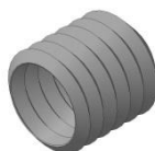
Тип Ц (цилиндр)